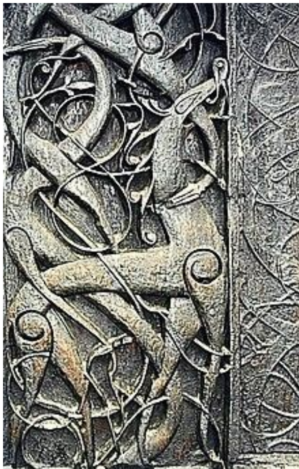
Portal vikingo de la iglesia de madera de Urnes (Luster, Noruega).