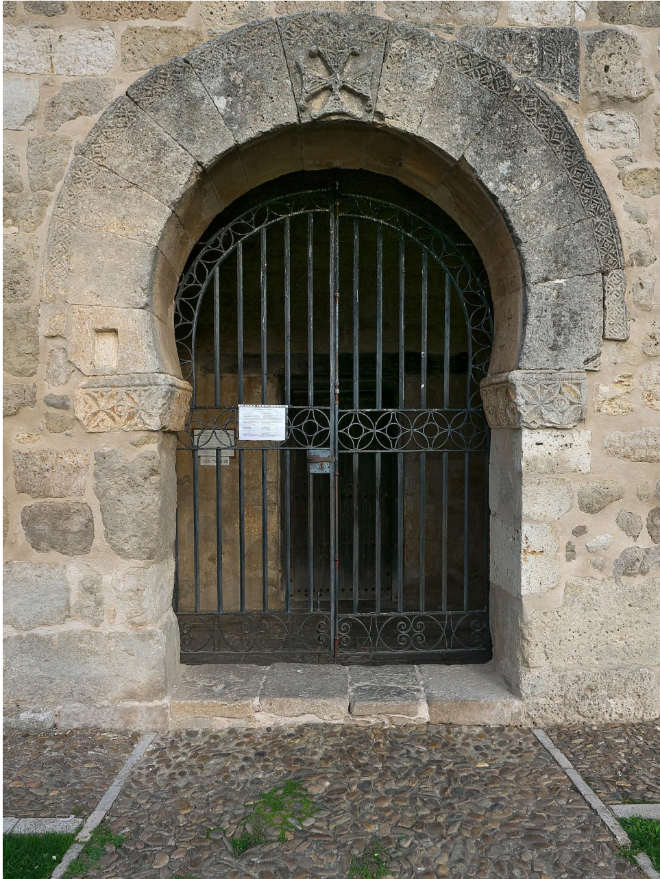
Arco de herradura. Puerta de acceso en San Juan de Baños.

incorporan el cimacio de tradición bizantina (que en el siglo VI poseían el sureste peninsular) Aportan el arco de herradura que será posteriormente asimilado por los árabes, la cubierta en el interior suele ser de bóveda de medio cañón y las iglesias tienen pocas aperturas, escasez de vanos.