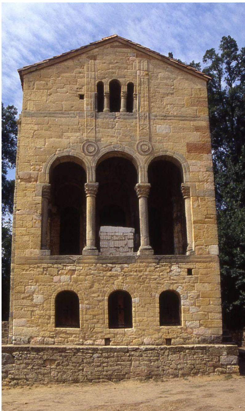
Fachada de Santa María del Naranco.