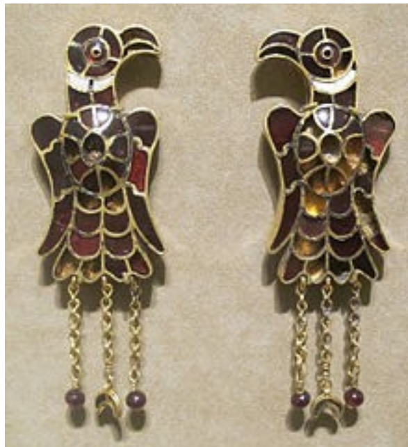
Pendiente ostrogodos. Wikipedia

Pueblos como los ostrogodos, los godos, los anglos, sajones, francos... aportan conocimientos a la fabricación de objetos fácilmente transportables, sean de lujo o utilitarios, destacando la orfebrería o trabajo de piezas de metal (broches, fíbulas, coronas, pendientes, etc).