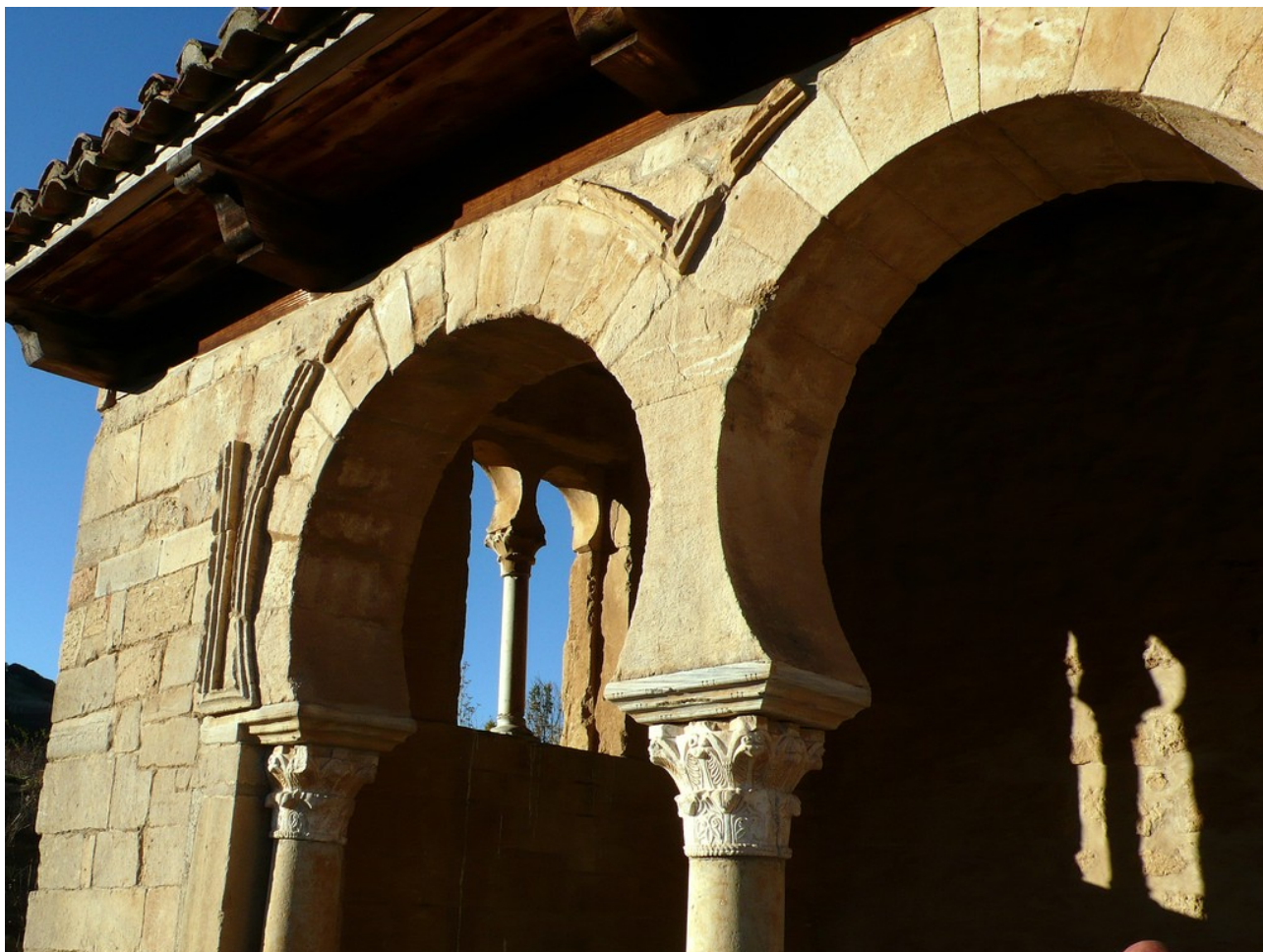
Arco de herradura en alfiz de San Miguel de la Escalada.