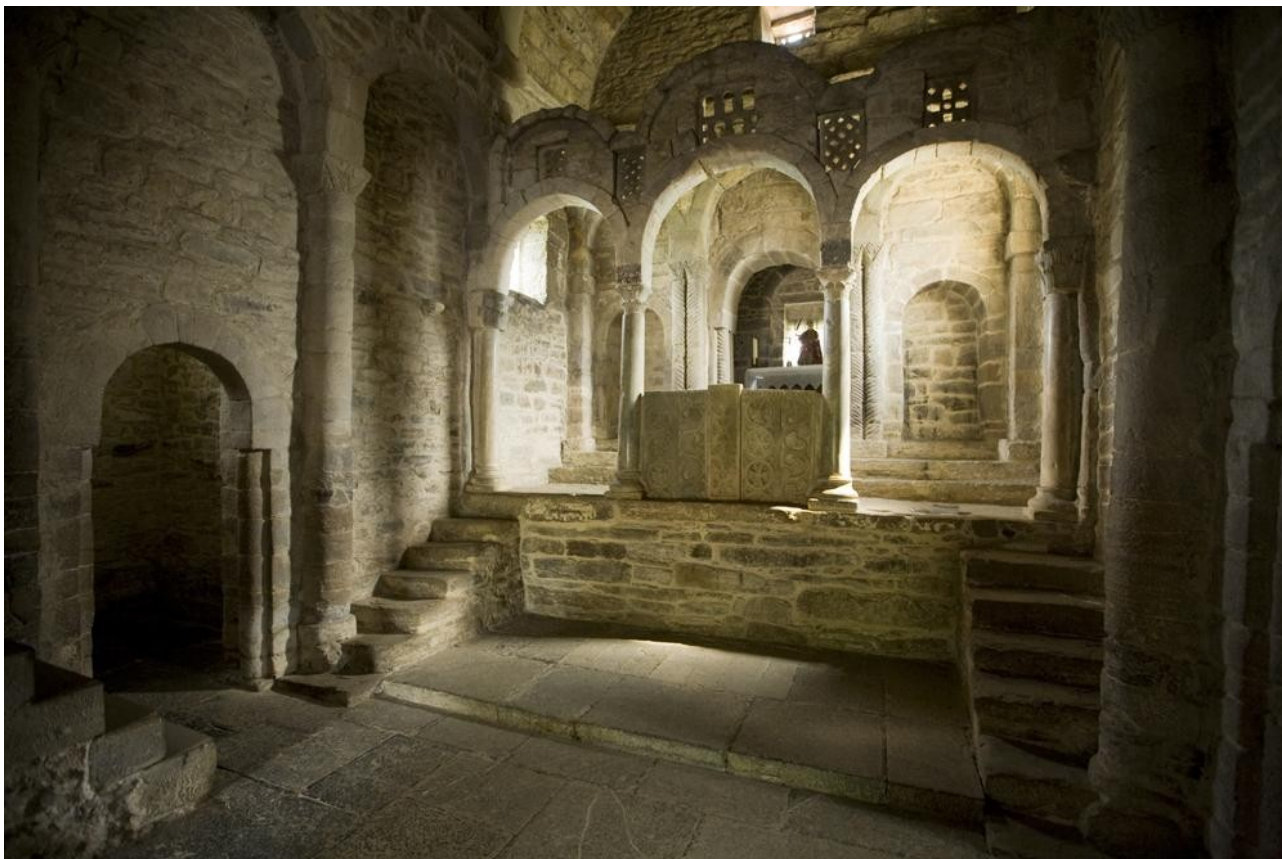
Interior de Santa Cristina de Lena.