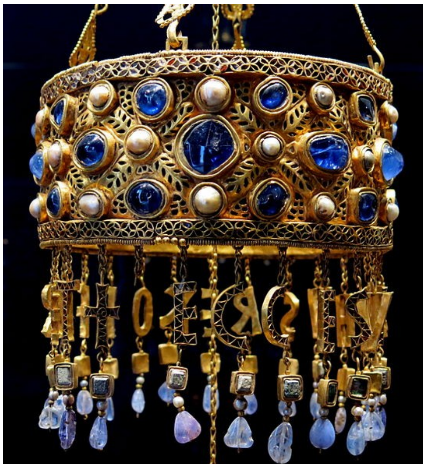
Corona visigoda de Recesvinto.