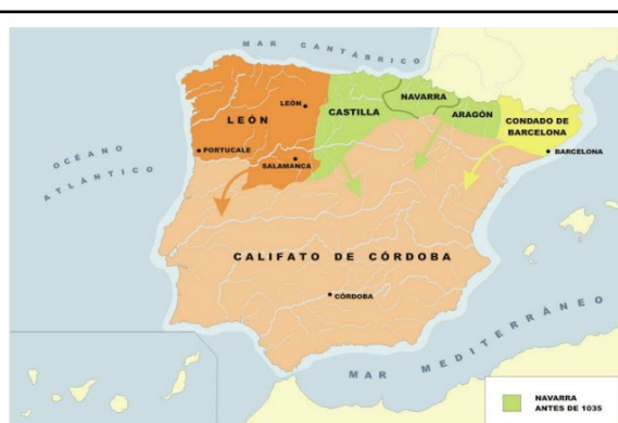
Reinos Cristianos. IX -X / Emirato de Córdoba S. IX-X

La superioridad del Emirato es evidente.