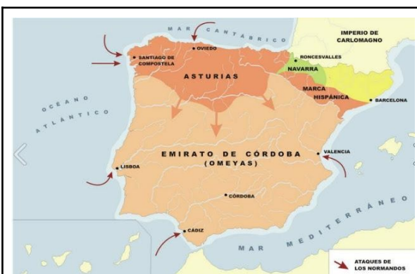
Reinos Cristianos. IX -X / Emirato de Córdoba S. IX-X

En el mapa se aprecia la frontera de los reinos cristianos con el Emirato de Córdoba (dinastía de los Omeyas).