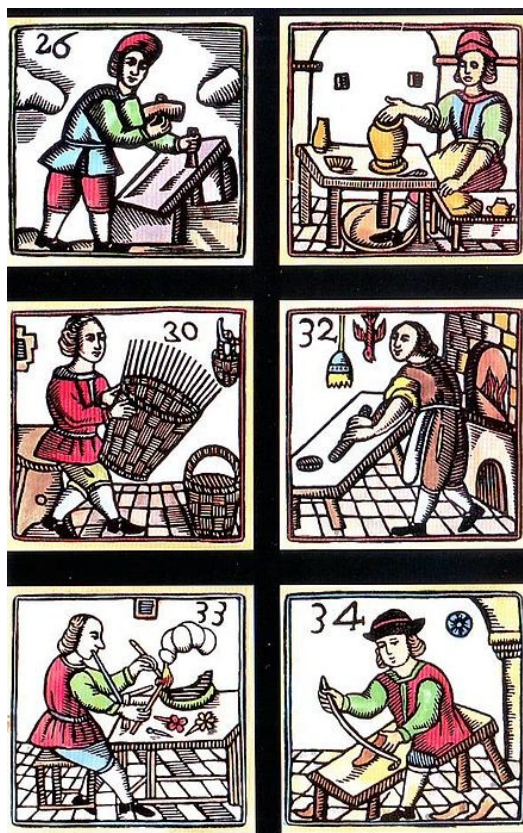
Oficios del gremio.

El descenso de la demanda hizo que muchos talleres de gremios se cerraran, con la consecuente disminución del tráfico comercial, sobre todo de productos de uso cotidiano y primera necesidad. Por ejemplo, las ricas zonas de Flandes y el Norte de Italia, con talleres textiles, disminuyeron su producción en un 80%.