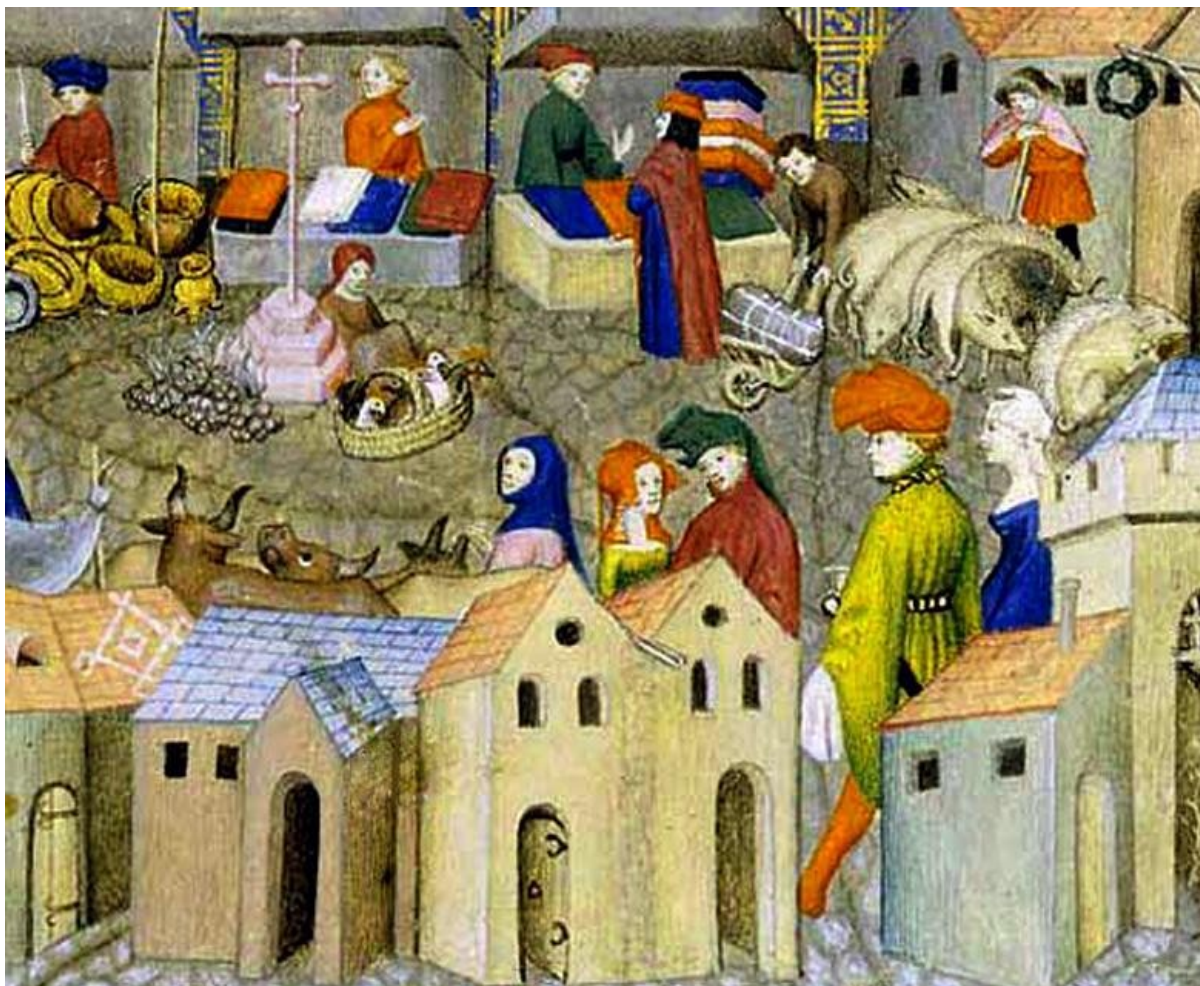
Imagen de una feria medieval.

Además, todos estos fenómenos hicieron cuestionar el orden feudal, especialmente por parte de los habitantes de las ciudades, que eran llamados burgueses, y que no hallaban su lugar claramente dentro del orden feudal medieval (clero, nobles, campesinos).