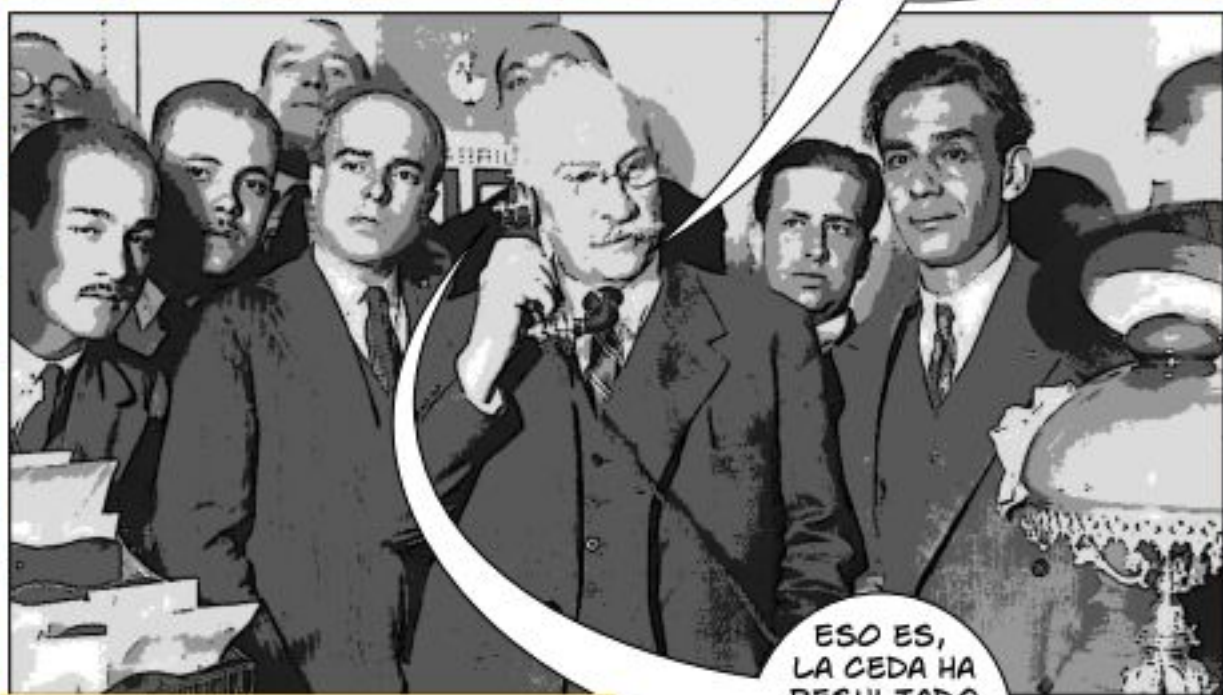
Alejandro Lerroux, del Partido Radical es el nuevo presidente.

ENTONCES, ¿HAN GANADO LAS DERECHAS PERO YO SOY EL NUEVO PRESIDENTE?