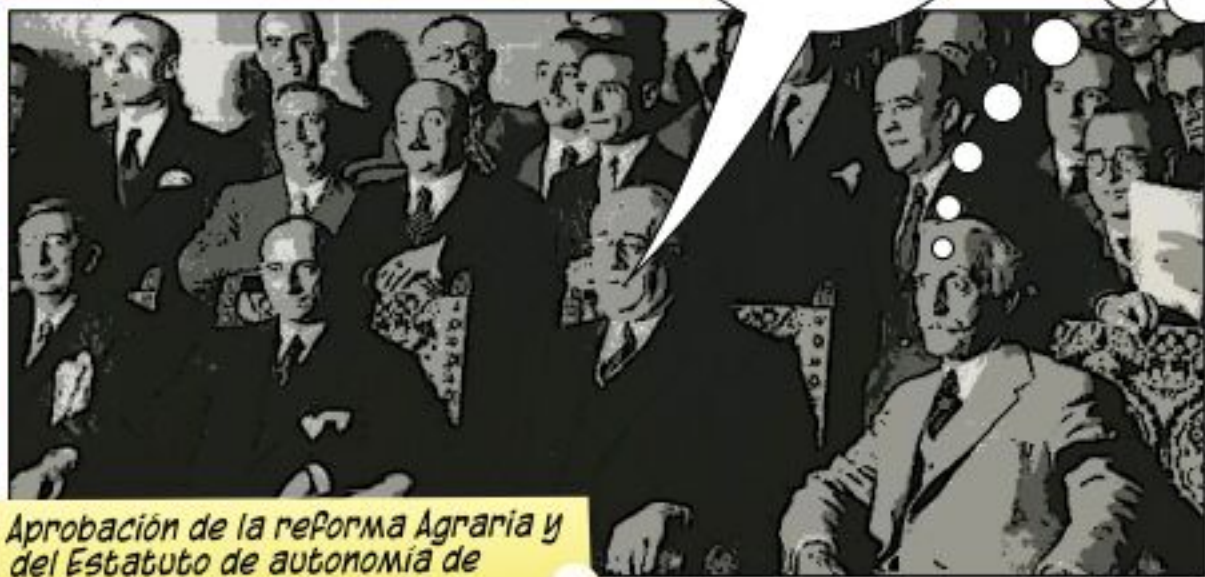
Aprobación de la reforma Agraria y del Estatuto de autonomía de Cataluña de 1932, se reúnen Azaña, Macià y otros cargos.