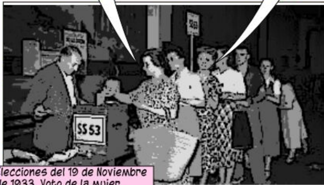
Elecciones del 19 de Noviembre de 1933, Voto de la mujer.