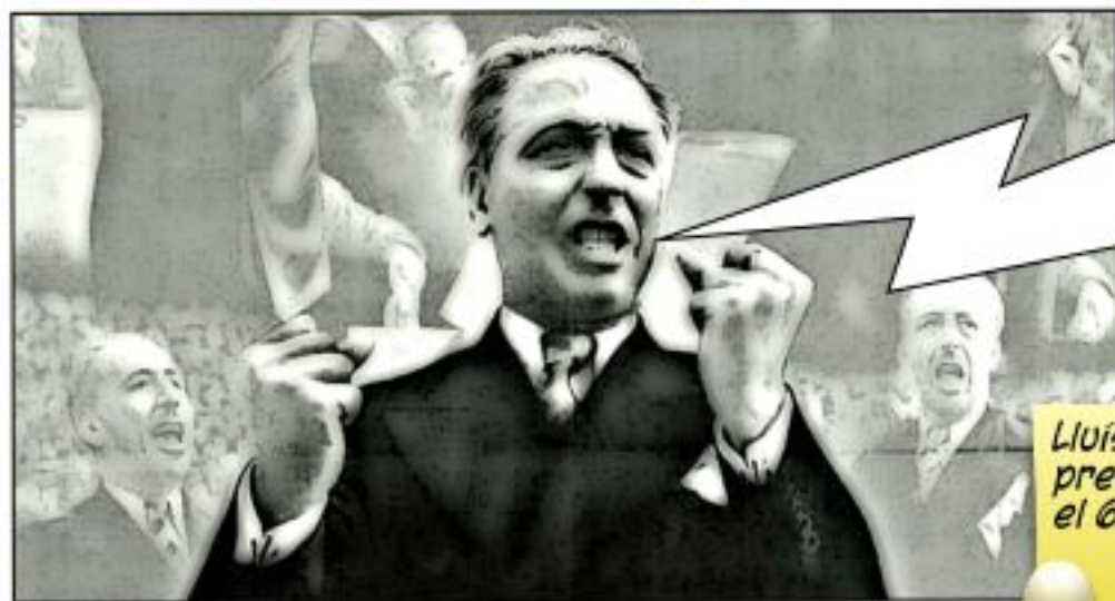
Lluís Companys, nuevo presidente de la Generalitat el 6 de Octubre de 1934.

A PARTIR DE AHORA CATALUÑA SERÁ UN ESTADO INDEPENDIENTE DENTRO DE LA REPÚBLICA FEDERAL ESPAÑOLA.