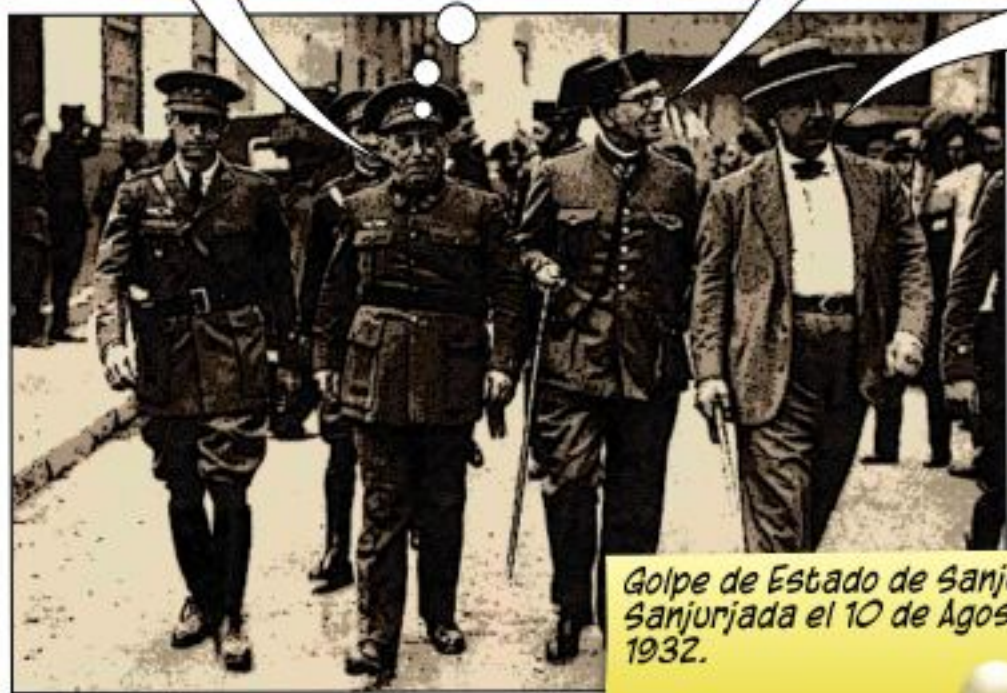
Golpe de Estado de Sanjurjo o Sanjurjada el 10 de Agosto de 1932.

NOSOTROS LOS MONÁRQUICOS TAMBIÉN NOS SUBLEVAMOS.