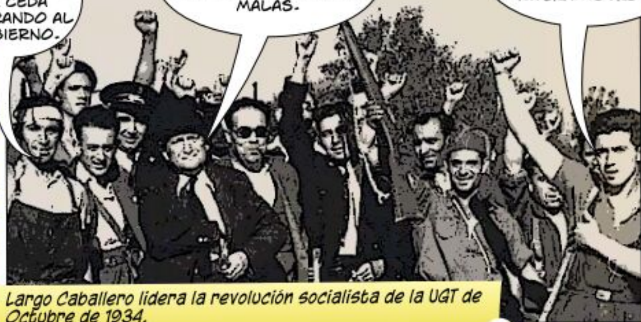
Largo Caballero lidera la revolución socialista de la UGT de Octubre de 1934.

¿QUIÉN SE CREE EL GIL ROBLES ESTE? ¿Y PRIMO DE RIVERA...OTRO?