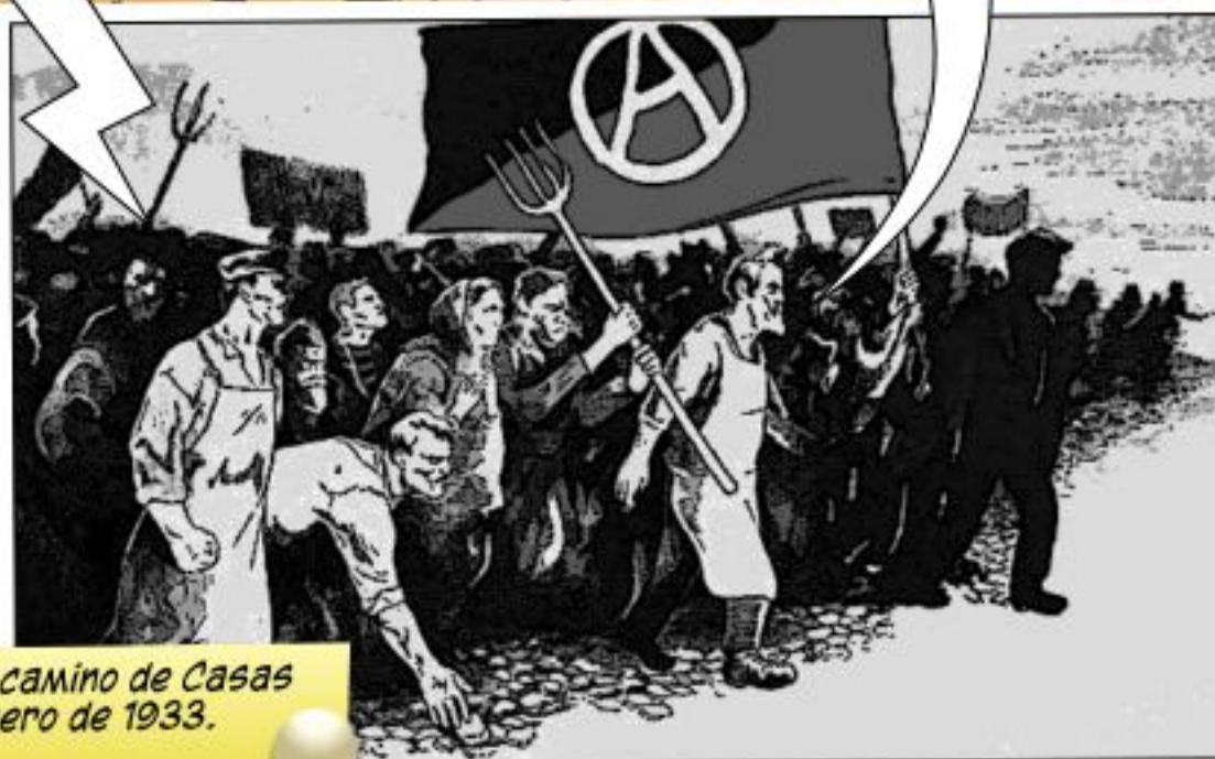
Los anarquistas camino de Casas Viejas el 10 de Enero de 1933.

AQUÍ HEMOS LLEGADO Y EL COMUNISMO LIBERTARIO CON NOSOTROS.